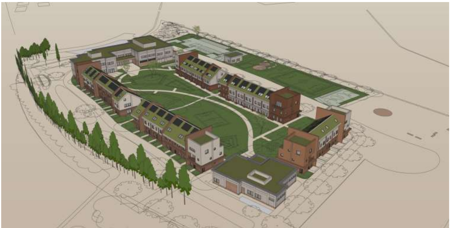
Figuur 1: 3D impressie toekomstbeeld

Er zijn ook nog allerlei losse opmerkingen gemaakt. Bijvoorbeeld over het handhaven van de bomenrij aan de Nijkerkerweg. De bomen aan de oostzijde van de Nijkerkerweg worden zoveel mogelijk behouden. Een uitzondering is er voor het realiseren van de toegang voor de wijk. De bomen aan de westzijde worden met de aanpassing van de Nijkerkerweg vervangen door nieuwe aanplant. Mensen maken zich zorgen over afval in de omgeving van het azc. De gemeente plaatst zelf geen prullenbakken. Maar we zullen het COA vragen om dit op het terrein wel te doen. Meerdere malen klont de vraag waar de supermarkt in de wijk Bloemendal komt. Deze is gepland, grenzend aan de Bloemendallaan in fase 2B. Andere vragen, bijvoorbeeld over de inhoud van een draaiboek voor de bewoners van het azc, over training geven aan medewerkers en vrijwilligers, enzovoorts komen in een latere fase aan de orde. De vragen of er een buslijn naar het azc komt, hoe de speelvoorzieningen op het azc-terrein eruit gaan zien, de opmerkingen over biodiversiteit en soorten bomen, enzovoorts komen in een latere fase aan de orde. En zo is er nog een aantal losse opmerkingen of vragen. Deze worden waar nodig meegenomen in de nota van beantwoording of de volgende fasen. We houden u hiervan zo goed mogelijk op de hoogte.